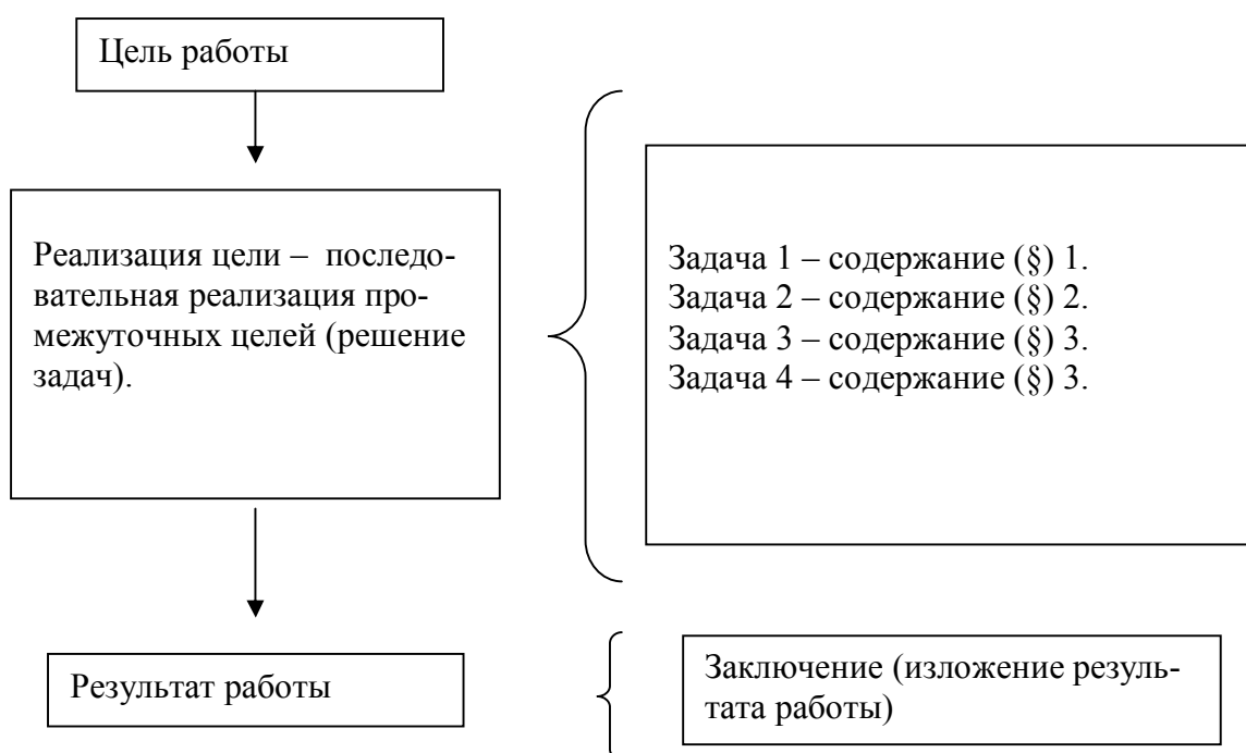
Рис. 1 Соотношение цели, задач, содержания и результата работы

Соотношение цели, задач, содержания и результата работы представлено (примерной) схемой (рис. 1).